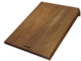
Tabla de corte deslizante de madera Iroko 8656 001